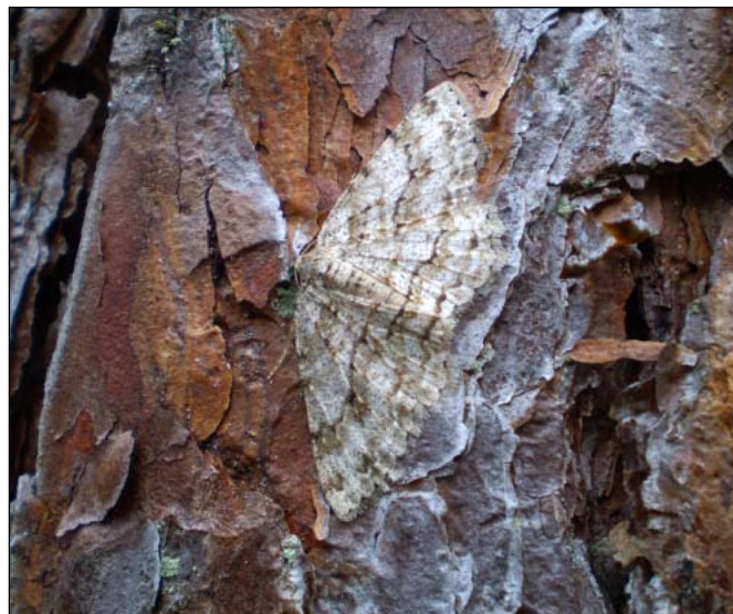
Abb.3 und 4: Raupe und Falter des Heidelbeerspanners